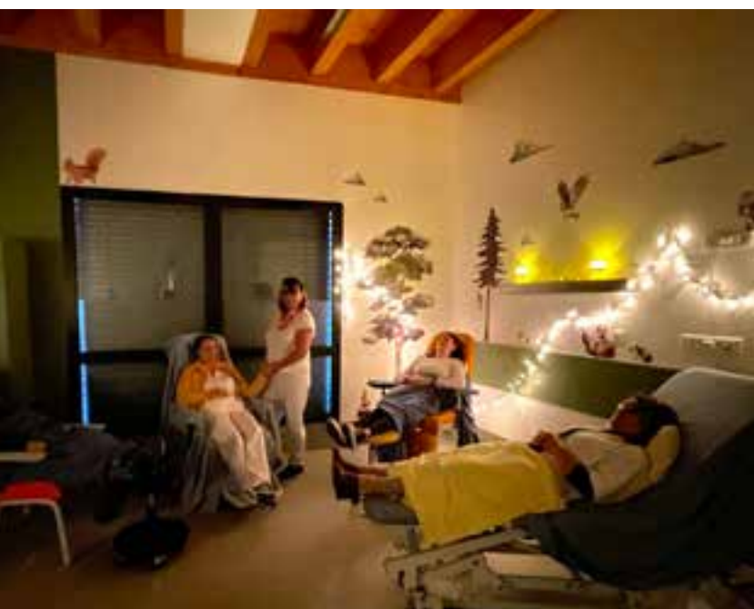
Journée dédiée à la découverte des moyens de lutte contre la douleur

Formation des soignants de l'ESEAN à l'hypnoanalgésie pour améliorer la prise en charge de la douleur et notamment la douleur chronique chez l'enfant et l'adolescent.